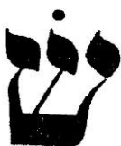
Fig. 4 : Les noms de Jésus

-Y Sh W chA référencé dans la Bible (53)